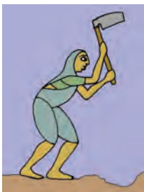
श्रम सभी संपत्तियों का स्रोत है।

उत्खनन सहित कृषि (जिसे प्राथमिक क्षेत्रक भी कहते हैं) और विनिर्माण (जिसे द्वितीयक क्षेत्रक भी कहते हैं), इन दो क्षेत्रकों के बीच उत्पादन-गतिविधियों का विभाजन आर्थिक विकास का संभवतः प्रथम दृष्ट स्वरूप था। यह विभाजन 'श्रम-विभाजन' की प्रक्रिया के माध्यम से हुआ। यह नाम अर्थशास्त्र के जनक एडम स्मिथ द्वारा दिया गया था। इस प्रक्रिया की संक्षिप्त व्याख्या नीचे की गई है।