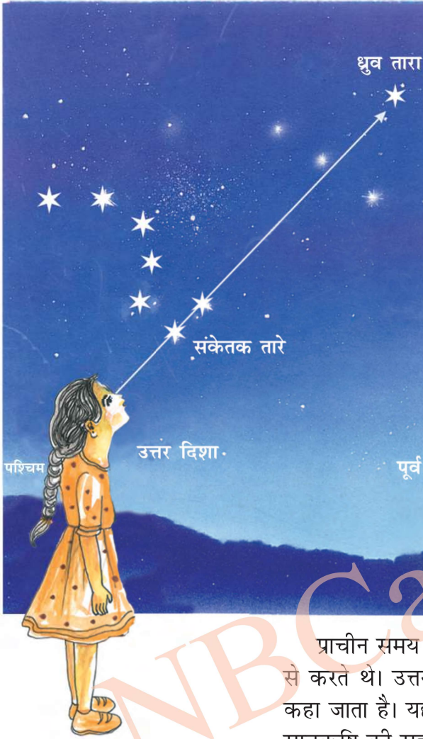
चित्र 1.1: सप्तऋषि एवं ध्रुव तारा